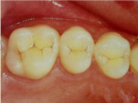
Fissuren der Backenzähne