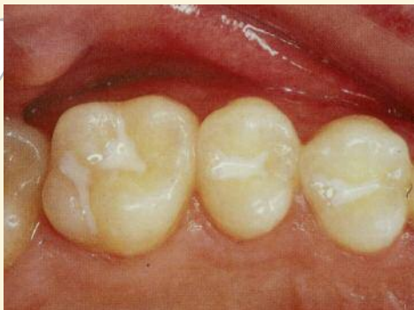
Versiegelte Fissuren der Backenzähne

Je tiefer und enger diese Fissuren sind, desto stärker ist der Zahn kariesgefährdet. Auch die sorgfältigste Zahnpflege reicht nicht aus, da die Borsten der Zahnbürste meist nicht ganz bis auf den Grund der Fissuren hinabreichen.